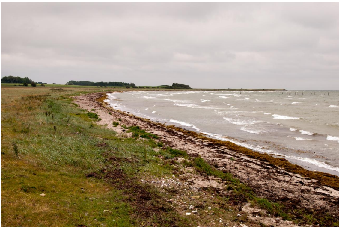
Et kig langs stranden mod Sevedø